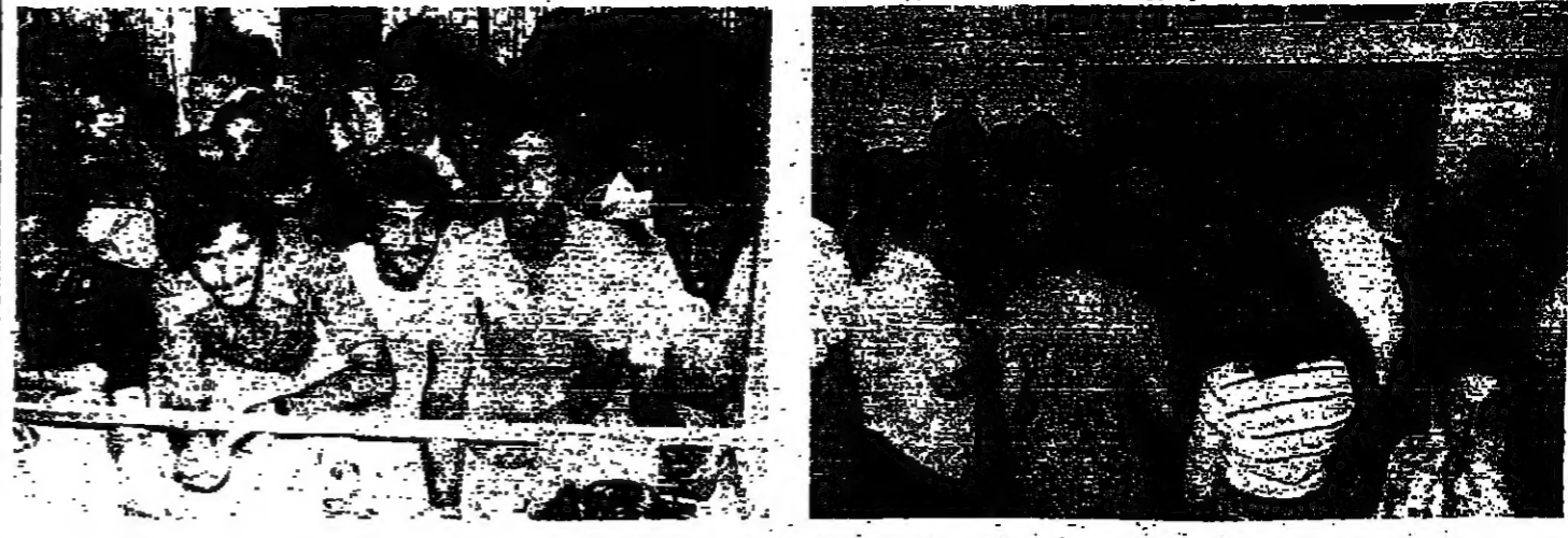
التفاهت على التمتع من الخارج ومن الداخل

بعد العمدة والاساندة والطلاب ، جاد دور لجنة التربية القبول على معالجة هذه الاسباب بصفة كادها في رسوم تنظيم الجامعة كادها في رسوم تنظيم الجامعة . ابو شرف ، رئيس اللجنة امس ان جهود الجهات الرسمية والقطاعات المعنية ، تصب في الوقت الحاضر على معالجة اسباب ردود الفعل السلبية التي تلقت عن الرسوم الاشتراكية المتعلق باسنادة تقسيم الجامعة اللبنانية ، مشرا الى ان الرئيس النيابي سركسي ، والدكتور اسعد وزقر وزير التربية والدكتور بطرس